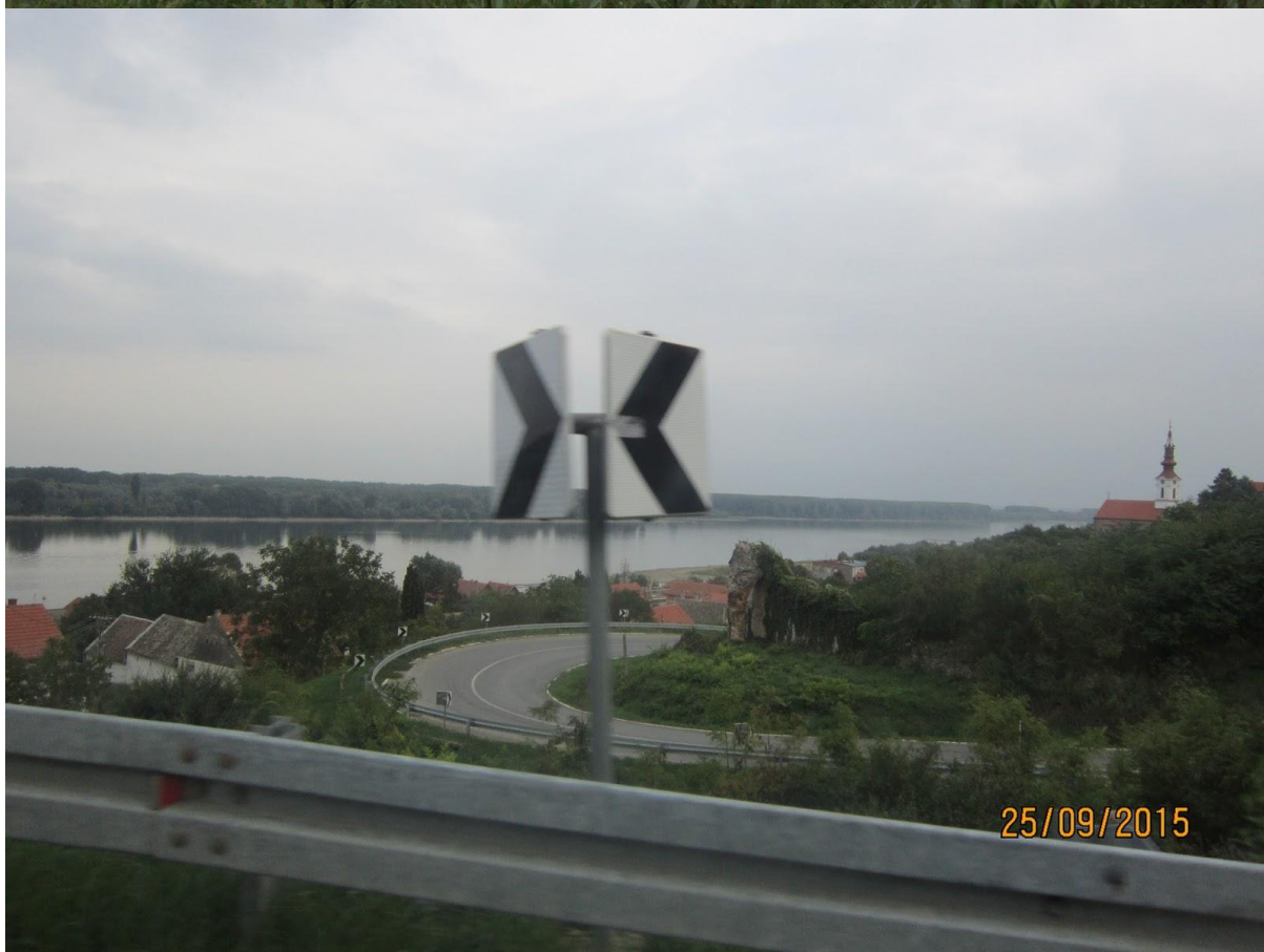
A torkolat fényképe a levegőből